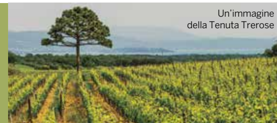
Un'immagine della Tenuta Trerose

Una selezione, a cura delle aziende, di alcune delle novità che saranno presenti alla manifestazione in programma il 20 e 21 giugno prossimi presso la Tenuta Trerose (Bertani Domains) a Montepulciano (Si)